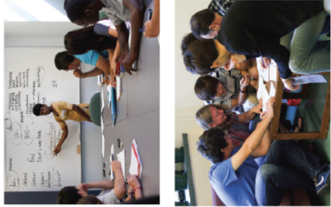
Aprende con talleres, colaboraciones, trabajo en grupo y estudio independiente.

Ubicado en la bella y segura ciudad de Montreal , el College Vanier es reconocido por sus métodos de enseñanza en inglés. Con los mejores profesores certificados, excelentes instalaciones y educación de prestigio, el College con una historia educativa desde 1837, era un internado para señoritas que evolucionó y oficialmente abrió