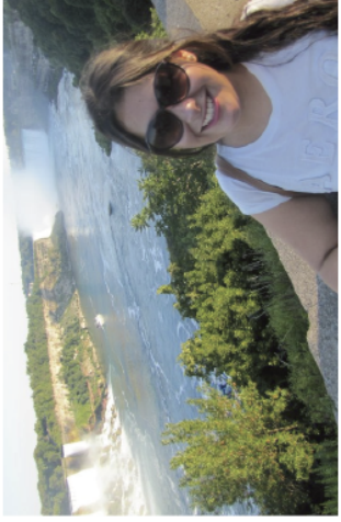
Excursiones incluidas: la Ciudad de Quebec y las Cataratas del Niágara o similares.*